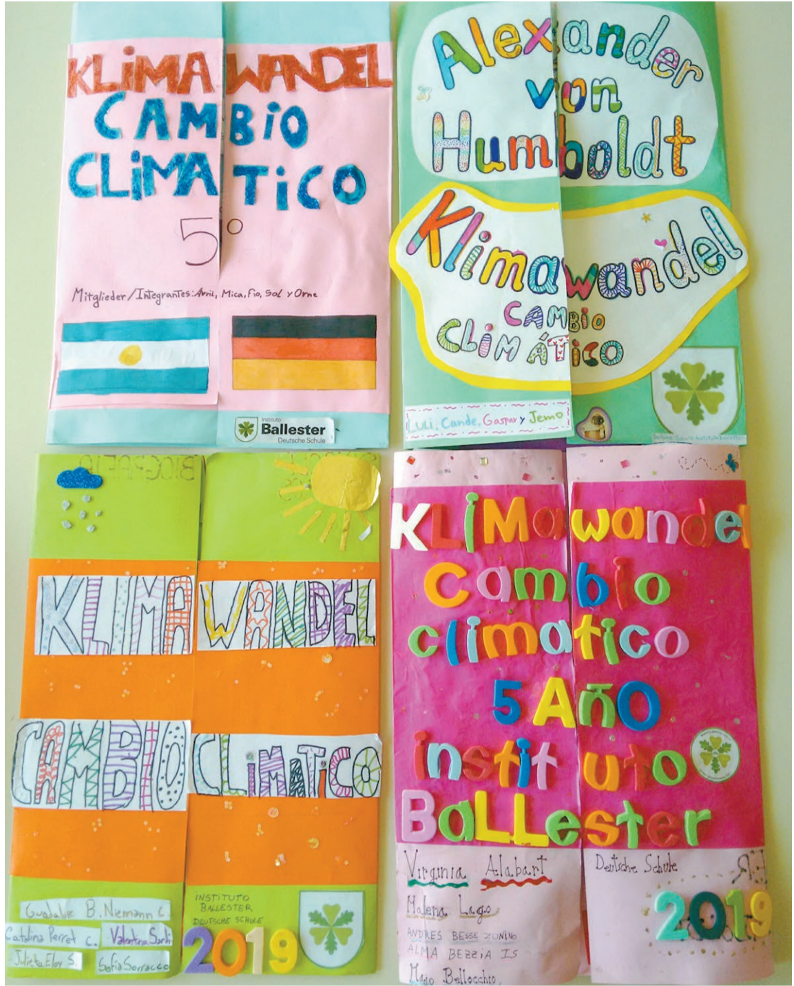
Von den Kindern gestaltete „Lapbooks“ (Faltpbücher).