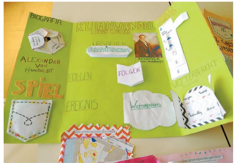
Alexander von Humboldt.